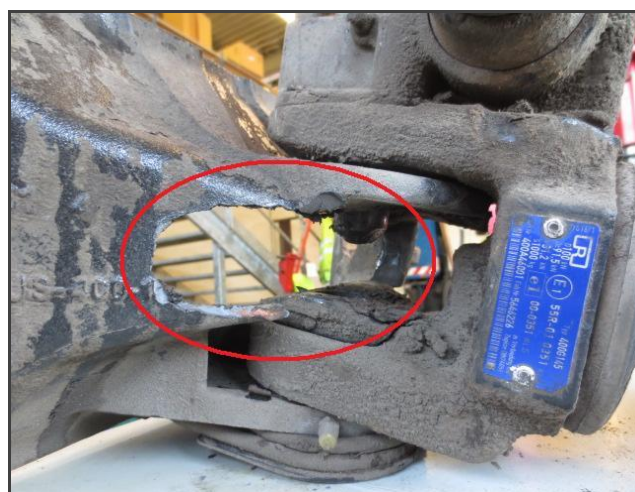
EXEMPLE : Rupture d'un attelage de remorque poids lourds

Nos connaissances portent sur l'ensemble des systèmes équipant toutes les gammes de véhicules (Voiture, Moto, PL, Matériel agricole et travaux publics, etc....).